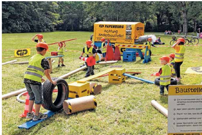
Die GP Kinderbaustelle bereichert inzwischen viele Veranstaltungen. Auch beim Laternenfest ist sie wieder dabei.

Die GP Kinderbaustelle ist auch in diesem Jahr wieder beim Laternenfest vom 28. bis 30. August mit dabei! Infos unter www.gp-kinderbaustelle.de