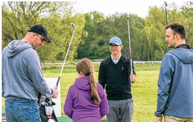
Freunde findet der Golfsport in allen Altersklassen.

Wie der große Besucherandrang zeigte, gibt es im Raum Halle jede Menge Golfinteressierte.