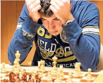
Am 12. Juli wird in Zwintschöna gekämpft.