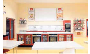
Kathi's neue Backstube.

Die Mitteldeutsche Zeitung lädt am 6. September, 10 bis 17 Uhr, wieder zum Tag der offenen Tür ins Medienhaus in der Delitzscher Straße ein. Neben geführten Touren durch Redaktionen, Druckhaus und andere Bereiche erwartet alle Besucher ein buntes Programm. Stargast ist der Sänger Hartmut Schulze-Gerlach alias Muck.