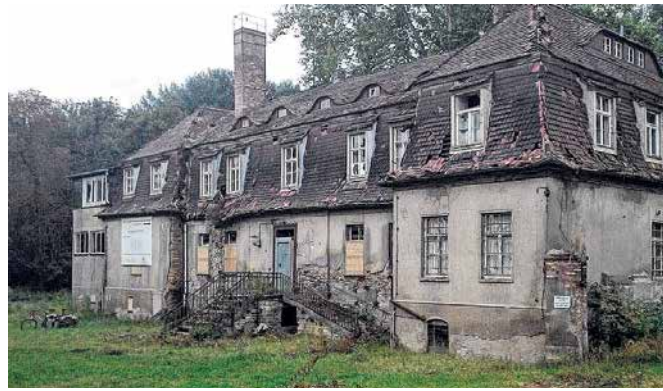
Das verfallene Gutshaus Sagisdorf in Reideburg, kurz vor seinem Abriss im vergangenen Jahr.