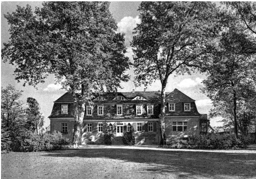
Historische Aufnahme vom Gutshaus Sagisdorf in Reideburg.

Die jetzt vorhandene Flä- che des ehemaligen Gutes Sagisdorf wird durch einen Immobilienträger für den Bau von Einfamilienhäusern vermarktet. Katrin Loth