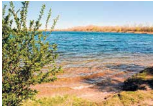
Der Hufeisensee.

Mit dem Abschluss der amtlichen Vermessung und dem Vorliegen der schriftlichen Freigabe des Baugebietes am 1. Juli können nun die praktischen Arbeiten am künftigen Golfpark beginnen. Ausführendes Bauunternehmen ist die E. G. S. Golf GmbH Dortmund, ein renommierter Fachbetrieb, der auf die Errichtung von Sportanlagen spezialisiert ist. „Voraussichtlich in vier Gruppen wird an verschiedenen Stellen des westlichen Seeufers gleichzeitig gearbeitet. Bevor es an die Feinheiten geht, müssen insgesamt 500 000 Kubikmeter Boden bewegt und rund zehn Kilometer Rohrleitun-