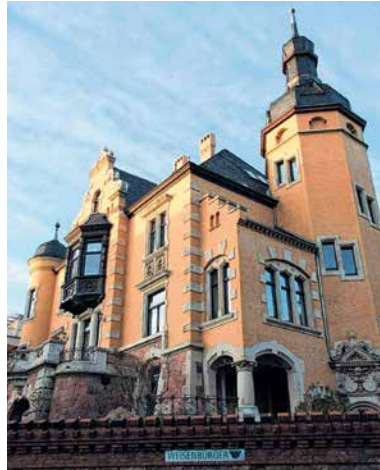
Sitz der Firma Weisenburger ist diese repräsentative, von ihr sanierte Gründerzeitvilla in Halle.