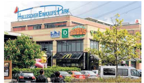
Der Hallesche Einkaufspark in Bruckdorf.