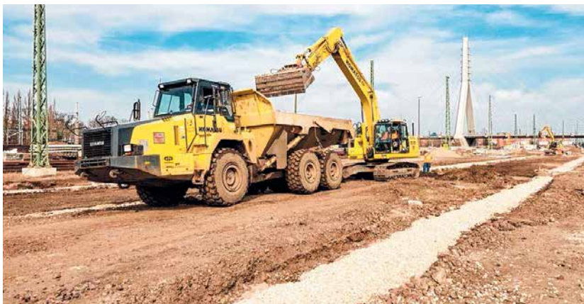
Rund um die Berliner Brücke in Halle entsteht der neue Knoten für den Schienenverkehr.

Weitere Informationen gibt es im Internet unter www.gp-ag