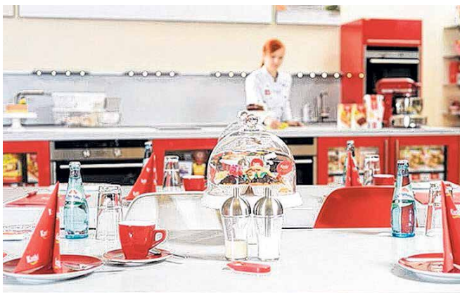
Willkommen in der neuen Eventbäckerei! Bild unten: Auch 2015 erhalten zehn Kita-Paten von KATHI wieder einen Scheck über 500 Euro sowie eine umfangreiche Backausrüstung.

Viele weitere Informationen zu Kathi's Backzauber gibt es telefonisch unter 0345/ 5700878 sowie im Internet unter www.kathi.de