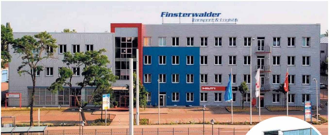
Das heutige Verwaltungsgebäude der Finsterwalder Transport & Logistik GmbH in Halle-Ost, Delitzscher Straße 72. Das Bild rechts entstand während der Sanierung 1999.