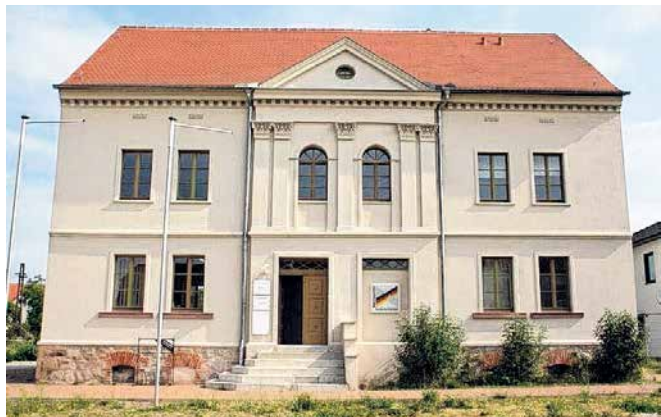
Das Geburtshaus von Hans-Dietrich Genscher in Reideburg ist heute die Begegnungsstätte Deutsche Einheit.

ist das „Genscher-Haus“, wie es in der Bevölkerung genannt wird, ein Ort, der an die schwierigen politischen Etappen der Wiedervereinigung erinnert: an die Offenhaltung der Deutschen Frage im Ost-West-Konflikt, den Dehler-Besuch in Moskau 1963 zur Unterredung über die Berlin-Frage, zur Ostpolitik der BRD, Brief zur Deutschen Einheit 1970, den KSZE-Prozess ab 1973, Glasnost und Perestroika, Genschers Appell in Davos 1987, Gorbatschow ernst zu nehmen, sowie seinen Auftritt in der Prager Botschaft 1989 und nicht zuletzt die Rolle der Ostdeutschen 1989, die sich auf den Straßen Freiheit und Demokratie friedlich erstritten. Besonderer Bestandteil ist ein Faksimile des 1990 abgeschlosse-