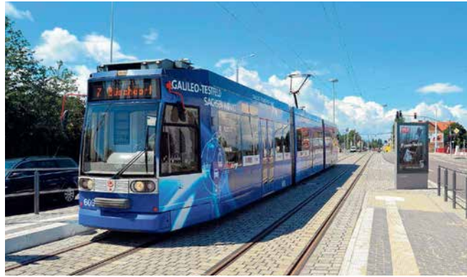
Eine der neuen Haltestellen in der Delitzscher Straße.

Die elf Kilometer lange Linie dient seit ihrer Fertigstellung 2012 als Verbindung zwischen Halle-Neustadt im Westen und Büschdorf sowie den Gewerbegebieten im Osten Halles. In etwa 30 Minuten von einer Endhaltestelle zur anderen, passieren Fahrgäste, aus Richtung Kröllwitz kommend, die Burg Giebichenstein, das Landesmuseum für Vorgeschichte, den historischen Marktplatz, die Franckeschen Stiftungen, den Hauptbahnhof und die älteste Schokoladenfabrik Deutschlands. Ebenso ist der